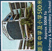
距离中学及小学 500 米 Approx 500M to Primary & Secondary School